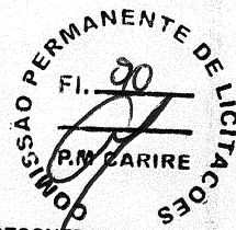
TABELA SEINFRA Nº 027.1 (DESONERADA)