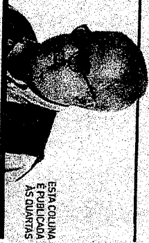
ESTA COLUNA É PUBLICADA AS QUARTAS