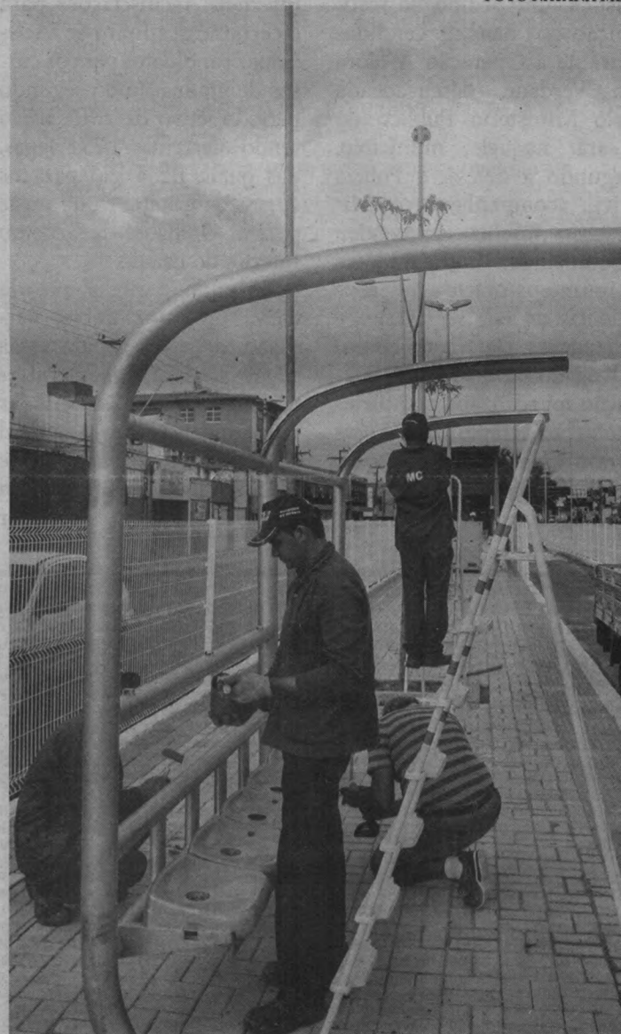
Corredor Expresso Fortaleza começará a funcionar no dia 18