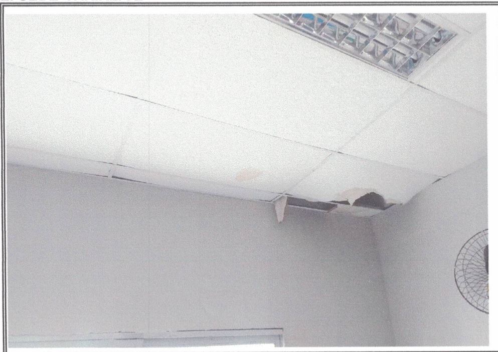
Foto 03 - Forro rachado.