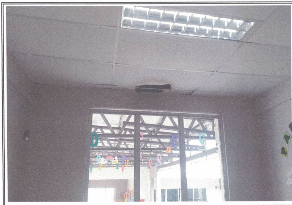
Foto 06 - Forro danificado.