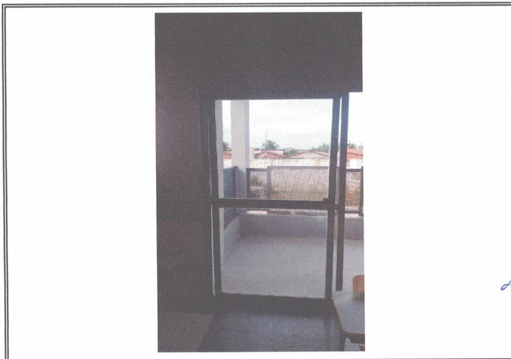
Foto 04 - Porta danificada.