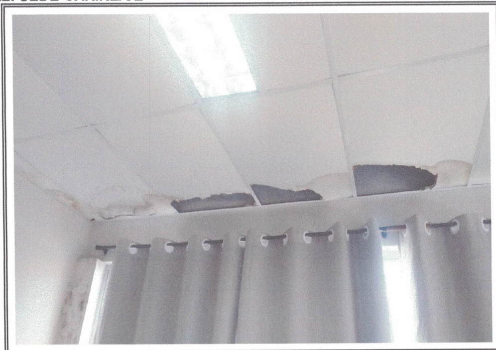
Foto 01 - Forro danificado.