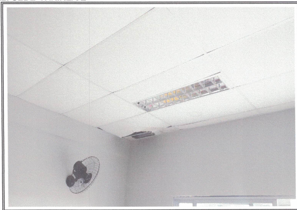
Foto 05 - Forro danificado.