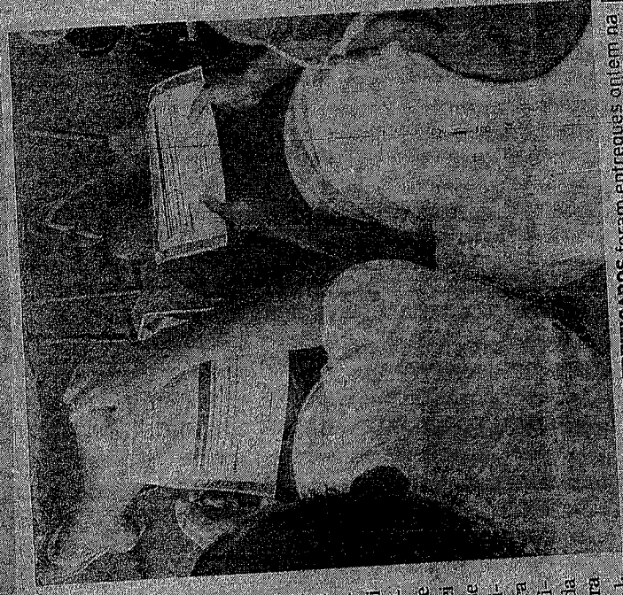
CERTIFICADOS foram entregues ontem na unidade prisional Imeldá Lima Pontes

"A princípio houve resistência, eles não se percebiam enquanto agressores. Eles não percebiam