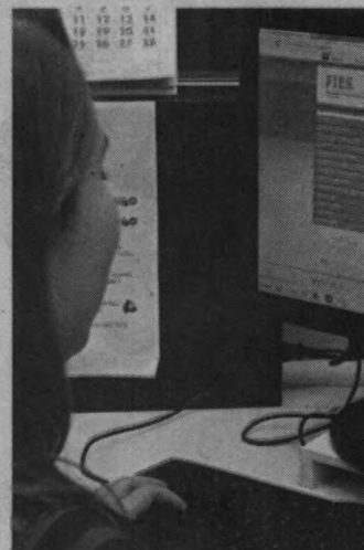
Segundo o MEC, estão isentos da regra estudantes que terminaram o ensino médio antes de 2010.

Além de estabelecer a nota mínima no Exame Nacional do Ensino Médio, o governo também passou a determinar em 2015 um teto para reajuste, de até 6,41% em relação ao ano