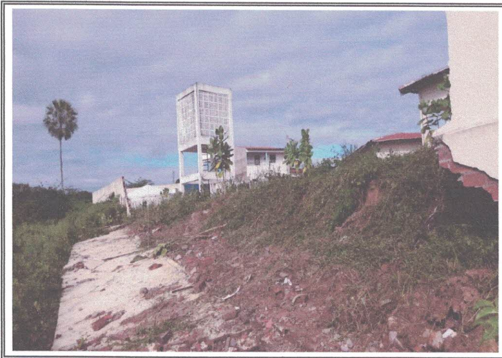
Foto 01 - Parede danificada.