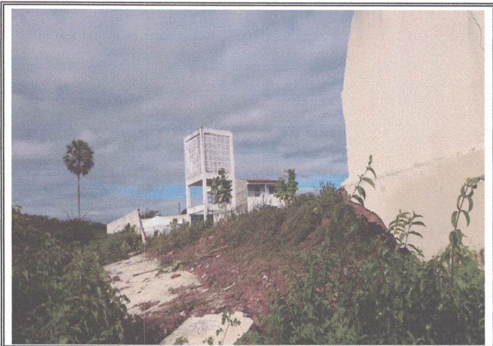
Foto 04 - Parede danificado.