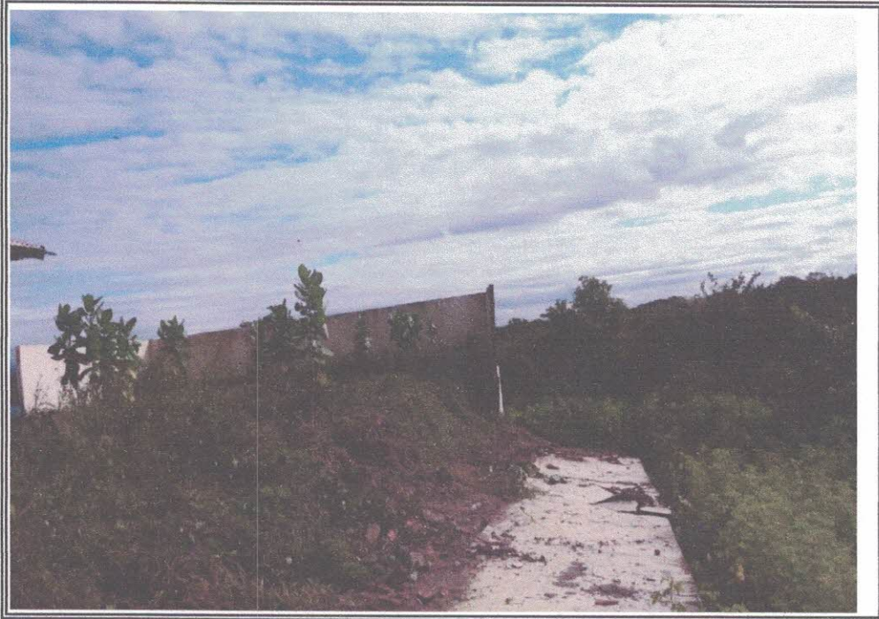
Foto 03 - Parede danificada.