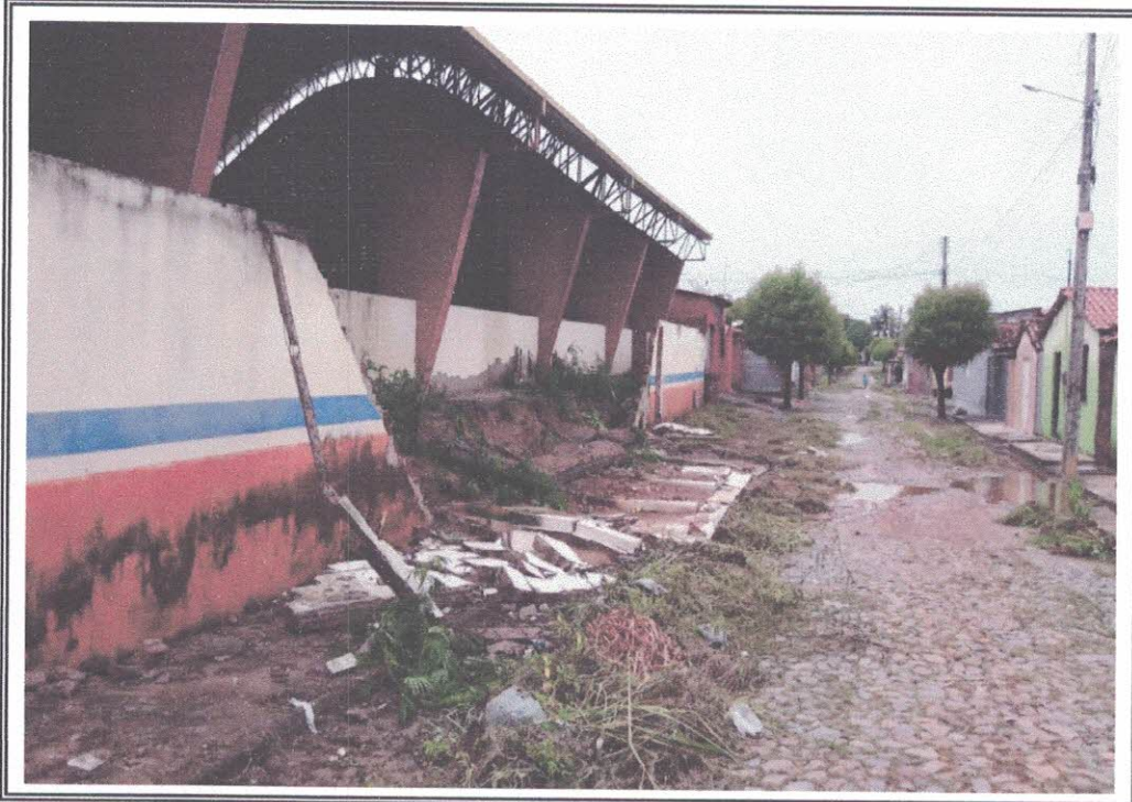
Foto 01 - Parede danificada.

PREFEITURA MUNICIPAL DE CARIRÉ OBRA: RECONSTRUÇÃO DO MURO, NA ESCOLA MARIA JOSE LOCAL: SEDE-CARIRÉ/CE