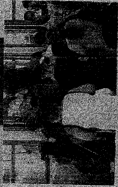
ECOMUM aglomeração nos terminais de ônibus de Fortaleza no horário de pico.

O retorno de 200 ônibus na frota de transporte urbano de Fortaleza, que havia sido encerrado na semana passada após dois meses desde a implantação da medida, foi prorrogado por mais um dia. Assim como na fase anterior, novamente os coletivos extras vão circular apenas nos horários de pico que vão de 6h às 9h e de 17h às 19h.