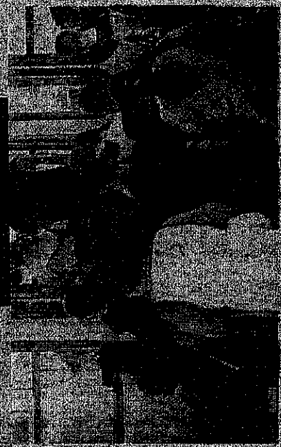
ECONOMIA - O governo federal, nos primeiros meses de 1964, conseguiu estabelecer uma política de controle de preços.

O governo federal, nos primeiros meses de 1964, conseguiu estabelecer uma política de controle de preços. O plano econômico para o ano de 1964 prevê um crescimento de 10% e uma inflação de 5%. O governo também anunciou medidas para controlar o mercado de trabalho e a distribuição de renda.