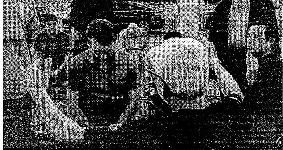
BOLSONARO, benção e orações diante do Palácio da Alvorada

para tentar retirá-lo do poder imediatamente, o que eles mais desejam, ou para desgastar até 2022", disse Eduardo neste domingo, 5. O deputado, filho "oz" de Bolsonaro, chamou de "meta usada demais" guerra o "confinamento" até o fim de abril contra a covid-19. O Ministério da Saúde, no entanto, tem planos para abril, maio e junho de quarentena e afirma que alguns Estados - São Paulo, Rio de Janeiro, Ceará, Distrito Federal e Amazonas - estão numa transição para uma fase de "descontrole da