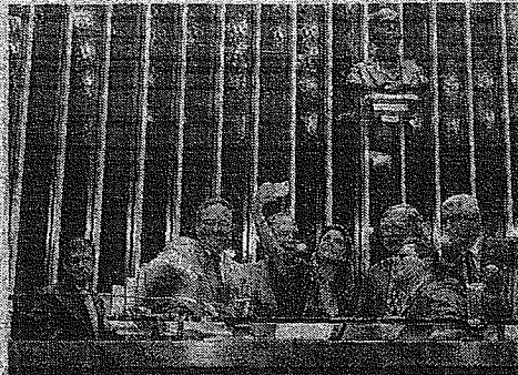
SENADORA Soraya Thronicke faz selfie com ministro Paulo Guedes e outros senadores para marcar aprovação