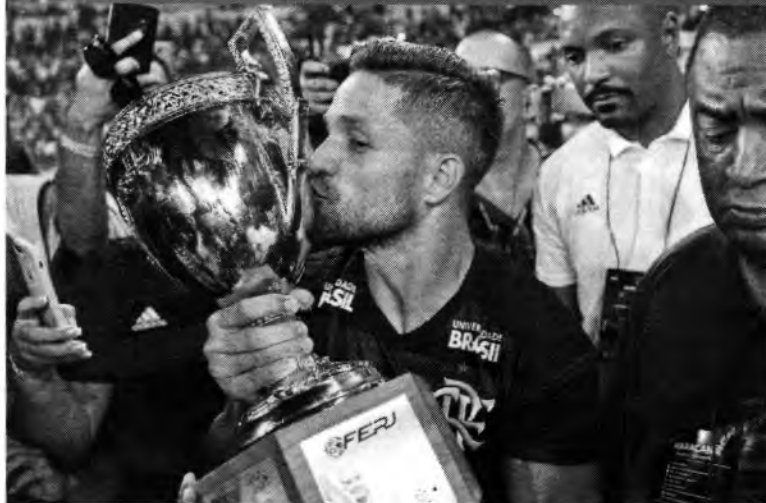
Flamengo foi campeão carioca em 2019

Na Europa, Lisboa: sede das fases finais da Liga dos Campeões