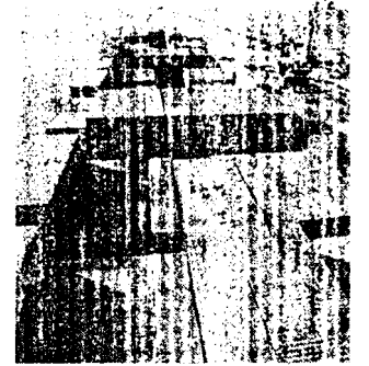
Atualmente, os Estados Unidos são o principal destino das exportações cearenses.

Mesmo diante das incertezas sobre a política econômica do próximo presidente dos Estados Unidos e seus impactos para o comércio mundial, o mercado, que tem aversão a cenário de incerteza, já mostrou que prefere a democrata Hillary Clinton ao republicano Donald Trump para ocupar a Casa Branca. Enquanto Hillary representa continuidade do governo Obama, Trump desperta dúvidas sobre como serão as diretrizes da política comercial americana.