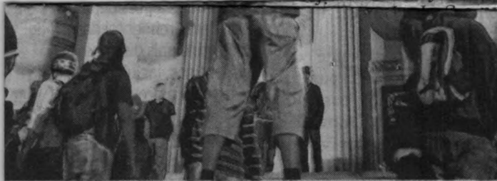
io Guanabara, sede do governo do Rio de Janeiro

ções dos manifestantes. Um rojão jogado pelos manifestantes atingiu uma fotografia e, por pouco, a bomba não explodiu nas costas dela. A maior parte dos manifestantes faz parte dos Black Blocs, vestidos de preto e com rostos cobertos, e por diversas vezes tentaram jogar rojões contra os policiais, que estavam dentro do palácio com escudos e capacetes e também posicionados do lado de fora, para tentar identificar os manifestantes mais exaltados.