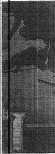
Divisão do país é cada vez mais evidente

EDITOR-EXECUTIVO: Guáiler George | gualiter@opovo.com.br; EDITORES-ADJUNTOS: Érico Firmo | ericofirmo@opovo.com.br; Erivaldo Carvalho | erivaldo@opovo.com.br; Italo Coriolano | coriolano@opovo.com.br