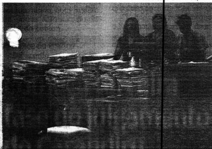
Este bloco, 15 policiais serão julgados pela morte de oito presos

A terceira etapa do julgamento do Massacre do Carandiru tem início hoje, às 9 horas, no Fórum Criminal da Funfaja, em São Paulo. A expectativa é de que o julgamento, presidido pelo juiz Rodrigo Tellini de Aguirre Camargo, dure uma semana. Nesta etapa, 15 policiais serão julgados pela morte de oito presos que ocupavam o quarto pavimento (ou terceiro andar) da antiga Casa de Detenção Carandiru.