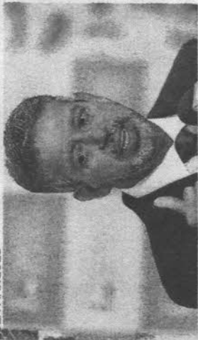
PRESIDENTE da Câmara dos Deputados, Arthur Lira