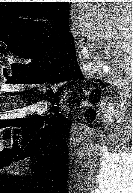
Prates apresentou projeto de refinaria para o Ceará

A Petrobras prepara um novo plano de investimento para a Refinaria Lubrificantes e Derivados do Nordeste (Lubnor), em Fortaleza. A intenção é transformar o equipamento na primeira refinaria "carbono neutro" do Brasil. Em série de agendas em Fortaleza, o presidente da estatal, Jean Paul Prates, apresentou o projeto para o governador do Ceará, Gilvane de Freitas (PT) e para