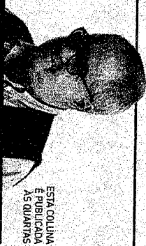
ESTA COLUNA É PUBLICADA AS QUARTAS